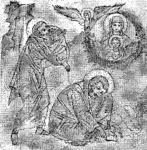
Icoana Rugului Aprins

Nu trebuie să obosem niciodată de a repeta că formula „crede și nu cerceta”, care nu are nici un temei în Sfânta Scriptură sau în Sfânta Tradiție, nu este doar străină creștinismului, dar este chiar potrivnică esenței sale. Scripturile ne învață, dimpotrivă, „să cercetăm toate lucrurile și să păstrăm ce este bun” (I Tes. 5, 21), căci „toate îmi sunt îngăduite, dar nu toate îmi sunt de folos” (I Cor. 6, 12). Mai adânc, Însuși Mântuitorul învață: „Cereți și vi se va da, căutați și veți afla...” (Mt. 7, 7), pentru ca sufletul credincios în Sfânta Liturghie, după Sfânta Împărtășanie, să rostească: „Am aflat credința cea adevărată, am primit Duhul Cel ceresc”. Nu este contradicție de principiu între credință și cunoaștere, între religie și știință. Revelația transmite în chip tainic esența Adevărului, pe care apoi științele îl dibuiesc în detaliile lui din ordinea fenomenală, fiecare cu mijloacele care îi sunt proprii.