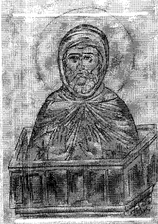
Sf. Simeon Stâlpnicul

Avva Dorotei îi zise fratelui: "Nu-ți osândi aproapele, căci tu îi cunoști păcatul, dar pocăința nu!".