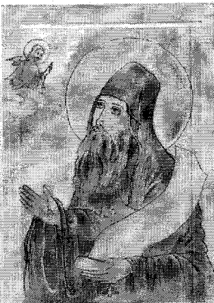
Sf. Siluan Athonitul

S-au dus frații la avva Antonie rugându-l: "Spune-ne nouă cuvânt, cum să ne mântuim?". "Ați auzit Scriptura? le-a răspuns bătrânul, atunci bine vă este vouă!". Ei au stărui: "Voim să auzim și de la tine, părinte!". Și le-a spus lor avva: "Zice Sfânta Evanghelie: de te va lovi cineva peste partea dreaptă a feței tale, întoarce lui și partea cealaltă! Eu zic: Voi, de nu puteți întoarce și pe cealaltă, măcar pe aceea una s-o suferiți!..."