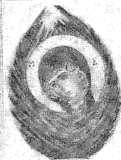
Icoana Rugului Aprins

Societatea preocupată mai mult de cele materiale este dominată de aceste valori trecătoare. Într-o asemenea societate, omul uită foarte ușor că are suflet și neîngrijindu-se și de acesta ajunge la un fel de nesimțire duhovnicească sau chiar moarte duhovnicească. În general, oamenii care ținesc mai sus decât scopurile materiale au modele nenumărate în Sfânta Scriptură.